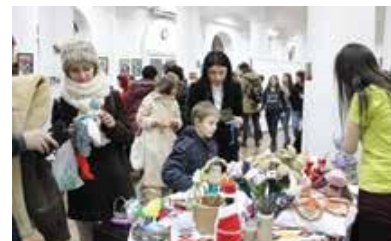
Seară de colinde „Crăciunul vine din inimă”

În cadrul concertului de caritate Matinee organizat de CONCORDIA Austria la Viena a fost semnat un memorandum de colaborare cu Ministerul Muncii, Protecției Sociale și a Familiei.