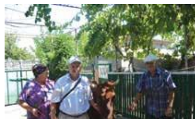
Donații de animale și păsări familiilor nevoiașe

Circa 414 copii din familii social vulnerabile din țară și din diferite forme de plasament CONCORDIA s-au bucurat de tabăra de vară de zi sau cu plasament organizate în centrele sociale din țară.