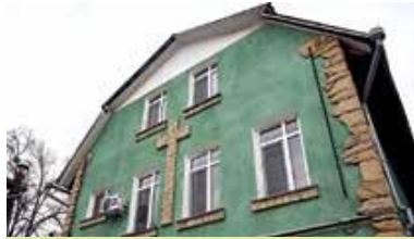
Deschiderea centrului de tineret Casa Ignatius

Cu ajutorul donatorilor din Austria am creat un cabinet stomatologic unde beneficiarii centrului social din Carahasani pot primi gratuit servicii stomatologice și de radiografie.