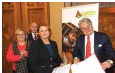
Memorandum de colaborare

Centrul multifuncțional Cosăuți oferă plasament temporar copiilor lipsiți de grija părintească și cuplurilor mamă-copil/copii aflate în situații de risc.