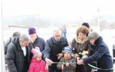
Deschiderea centrului multifuncțional CONCORDIA în satul Cosăuți