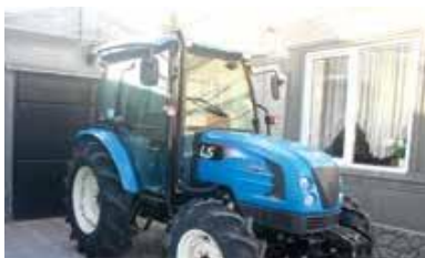
Crearea oportunităților pentru părinții educatori

Am ajutat 121 familii cu donații de aproximativ 2240 păsări, iar 12 familii numeroase au primit câte o vâcuță pentru a asigura necesarul de produse lactate în alimentația copiilor.