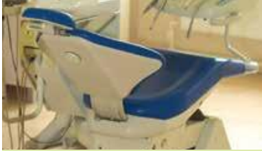
Cabinet stomatologic pentru beneficiarii din Carahasani

Cu ajutorul donatorilor din Austria am creat un cabinet stomatologic unde beneficiarii centrului social din Carahasani pot primi gratuit servicii stomatologice și de radiografie.