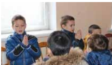
Reluarea activității centrului social din satul Rădoaia

În urma lucrărilor de reparație necesare, centrul social CONCORDIA din satul Rădoaia, raionul Sângerei, și-a reluat activitatea după o pauză de aproximativ 6 luni.