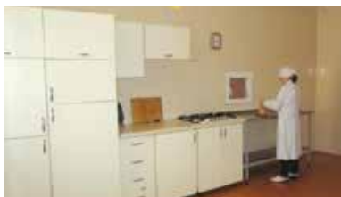
Renovări la centre sociale

În urma lucrărilor de reparație necesare, centrul social CONCORDIA din satul Rădoaia, raionul Sângerei, și-a reluat activitatea după o pauză de aproximativ 6 luni.