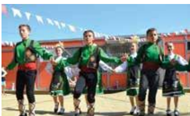
Tabăra de vară în centrele sociale

O vacanță de vară pentru 59 de copii din diverse forme de plasament. Copiii au avut parte de excursii, jocuri interactive, activități sportive în zone montane.