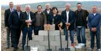
Lansarea proiectului fermei mixte ECONCORDIA

Orice copil are dreptul să crească într-o familie. În acest sens, am creat 4 case de copii de tip familial (Durlești, Coșnița, Holercani, Cahul), unde au fost plasați 18 copii rămași fără ocrotire părintească.