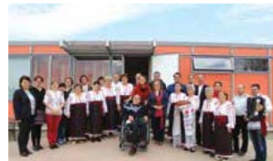
Oaspeți din Austria la centrul multifuncțional din Nisporeni

În fiecare an, în luna septembrie angajații centrelor sociale merg pe la casele bătrânilor singuratici și îi ajută în treburile casnice și cele gospodărești, precum și la culesul roadei și prepararea zarzavaturilor.