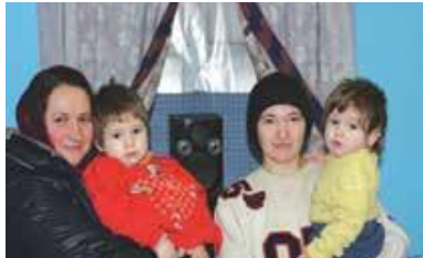
Casă pentru o familie cu 5 copii

În scopul susținerii părinților educatori, CONCORDIA oferă oportunități de sustenabilitate prin dezvoltarea de mici afaceri. Astfel o familie a primit donație de tractor, iar alta familie a primit utilajul necesar pentru apicultură.