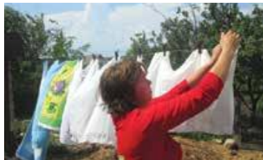
Septembrie – luna muncii sociale

Ferma ecologică ECONcordia este un proiect de antreprenariat social menit să ajute tinerii orfani sau din familii social-vulnerabile, bătrânii rămași fără îngrijire și familiile sărace. Ferma este concepută ca o fermă agricolă mixtă, vegetală și animală.