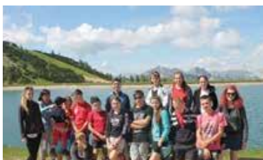
Vacanța de vară în Austria

Foștii copii CONCORDIA care au crescut, s-au stabilit pe la casele lor și au întemeiat familii își dau întâlnire în fiecare lună. Tineretele mămicii sunt îndrumate cum să se îngrijească în timpul sarcinii și cum să aibă grijă de nou născuți.