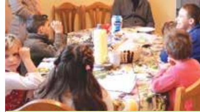
Crearea caselor de copii de tip familial

Aici, tinerii crescuți în formele de plasament CONCORDIA se întâlnesc pentru a simți atmosfera de casă, pentru a-i revedea pe cei cu care au crescut împreună.