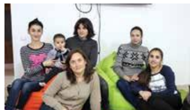
Clubul mămicilor cu pici

Pentru a asigura condiții decente de muncă ale angajaților și pentru a presta servicii sociale la un nivel înalt, au fost renovate bucătăria în centrul social din Beștemac și spălătoria în centrul social din Satul Nou.