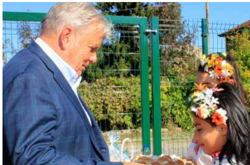
Hans Peter Haselsteiner Președinte CONCORDIA Internațional

Dragi prieteni, anul 2019 a fost frumos și cu reușite pentru serviciile noastre, suntem bucuroși să constatăm că anul acesta am avut în calitate de beneficiari peste 7.700 de persoane din cele patru țări în care se desfășoară proiectele noastre. Un alt număr, care ne face să ne simțim mândri, este cel de 512 voluntari care în 2019 și-au dedicat timp și efort pentru beneficiarii CONCORDIA.