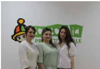
Departamentul Resurse Umane