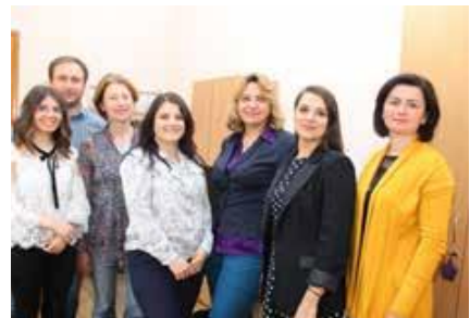
Departamentul Monitorizare și Prevenție