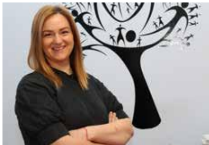
Departamentul Servicii de Plasament de tip Rezidențial Copii