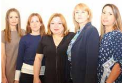
Departamentul Servicii de Plasament de tip Familial