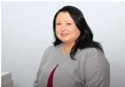
Departamentul Managementul Calității